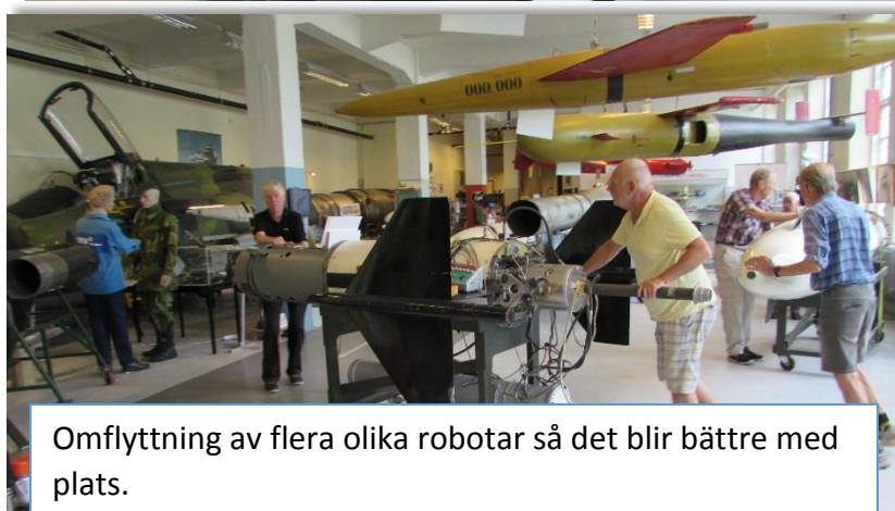
Omflyttning av flera olika robotar så det blir bättre med plats.