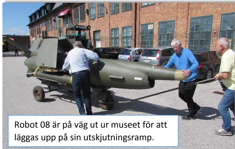
Robot 08 är på väg ut ur museet för att läggas upp på sin utskjutningsramp.