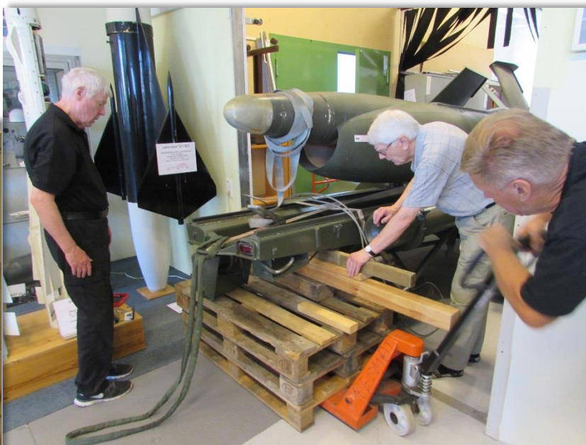
RB08 på väg in genom dörrhålet och vidare förbi pelare och övriga robotar till sin tilltänkta plats i museet.