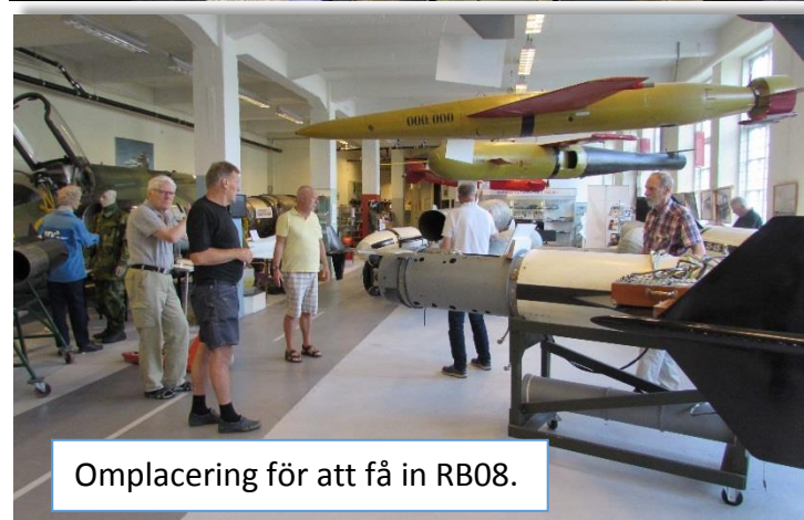
Omplacering för att få in RB08.

Demontering av branddörr för att vi ska kunna få in RB08 med utskjutningsramp i museet. Små marginaler, två centimeter på vardera sidan, men det gick med hjälp av många medarbetare att baxa in den på plats.